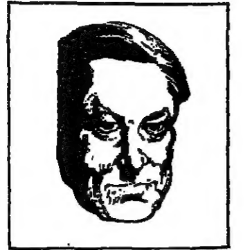
ابليوت : القصيدة

في هذه الحلقة نتبي الشاعر نارك الملائكة اعترافاتها التي سجلها زميلنا في القاهرة نبيل